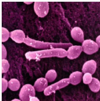
Candida vu au microscope