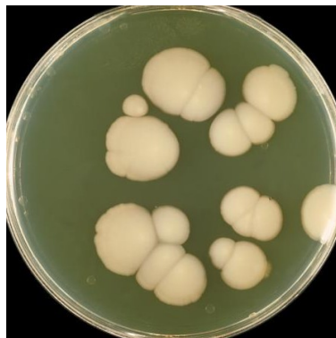
Candida albicans cultivé dans une boîte de petri

Le Candida est une levure (champignon unicellulaire). La souche la plus commune est le Candida albicans parmi les 9 souches actuellement référencées.